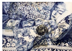
Verena Weckwerth, »Eine Titel«, 2020

In ihren aquarellierten Collagen zeigt Verena Weckwerth die Phasen zwischen, vor und nach den Aktionen der Motto gebenden »Netzwerkerinnen – Visionärinnen – Macherinnen«.