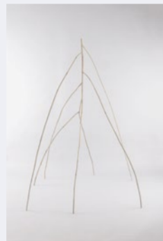
Ev Pommer, Fluss, 2016, Holz, 204x165x160 cm

Im Mittelpunkt der künstlerischen Arbeit der Berliner Bildhauerin Ev Pommer steht der Mensch mit seinen Erfahrungen und Empfindungen. Die Künstlerin versucht, mit ihren Objekten und Skulpturen Bilder für Situationen und Gefühle zu finden, die diesen entsprechen.