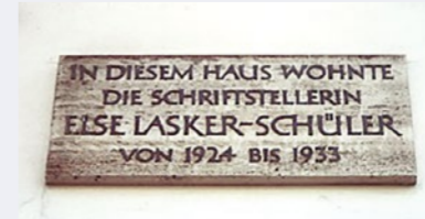
Hotel Sachsenhof

Auf diesem Spaziergang erfahren Sie von Frauen, die mit Gedenktafeln, Erinnerungsmalen oder Straßennamen geehrt wurden.