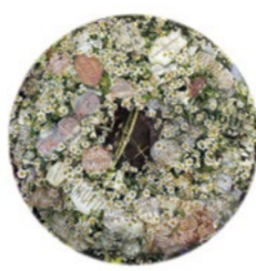
Frauenruh 1, 2016, 160 x 180 cm Digitalprint auf Papier

In der Kapelle auf dem Alten St.-Matthäus-Kirchhof zeigt Sigrid Weise ihre großformatigen Fotomontagen (je 175 x 160 cm) »Frauenruh«. Im Fokus stehen heutige und historische Frauengraber.