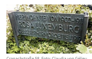
Cranachstraße 58

Die Autorin des zum 150. Geburtstag von Rosa Luxemburg erscheinenden biografischen Stadtführers »Rosa Luxemburg in Berlin« stellt bekannte und neue Orte aus dem Leben und Wirken der berühmten Sozialistin in Friedenau vor.